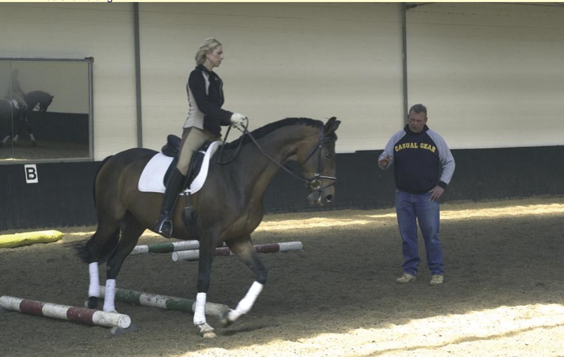
Statt Schläuchen können auch Stangen genommen werden, aber die Verletzungsgefahr ist größer.